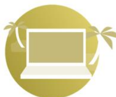
MEGATREND NEW WORK