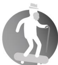
MEGATREND SILVER SOCIETY