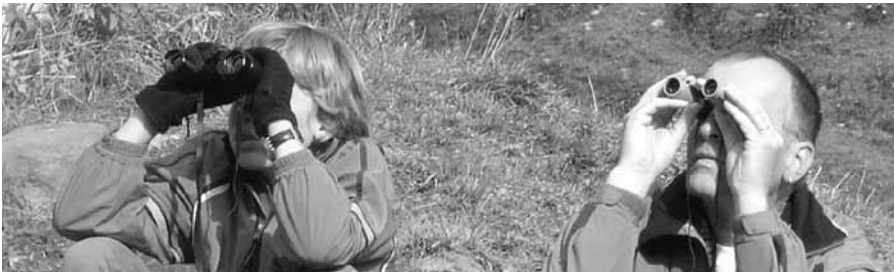
Wir sind auf der Suche nach dir.