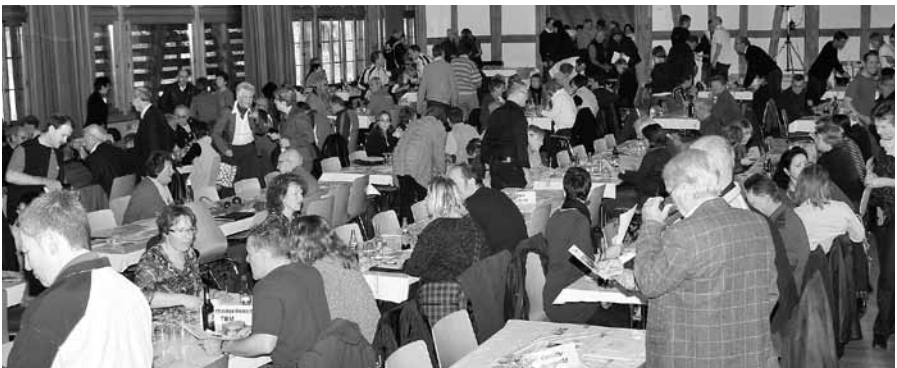
Langsam füllt sich der Gemeindesaal Schlossgut