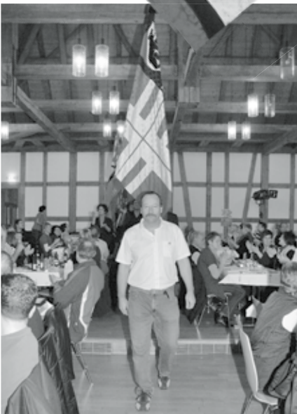
Einmarsch mit der alten Fahne