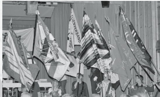
Neue TBM-Fahne mit Vereinsfahnen