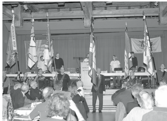
Verabschiedung der alten Fahne