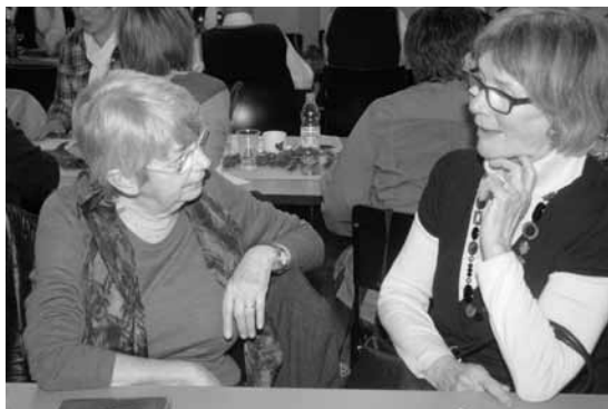
Was wird da getuschelt?

Die Jahresberichte des Präsidenten, des Chefs Information, der Chefin Betreuung sowie der Chefin der Technischen Leitung werden einstimmig und mit Applaus genehmigt.