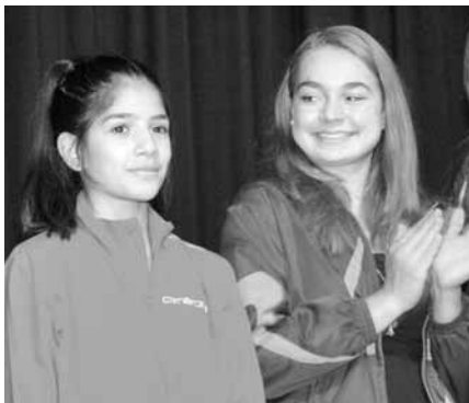
Erfolgreiche Sportlerinnen und Sportler

Turnende aus TBM-Vereinen konnten für tolle Leistungen an den Schweizermeisterschaften geehrt werden: