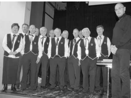
Turnerchörli TV Worb