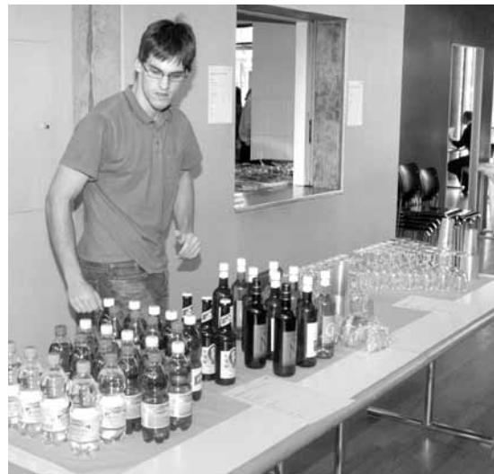
Herzlichen Dank dem TV Worb für die tolle Bewirtung