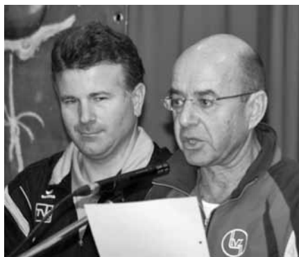
Infos über den Jugendsporttag 2014

Diese finden am 23./24.08.2014 in Zollikofen statt. Detailinformationen auf der Homepage www.tbmjugendsporttag2014.ch .