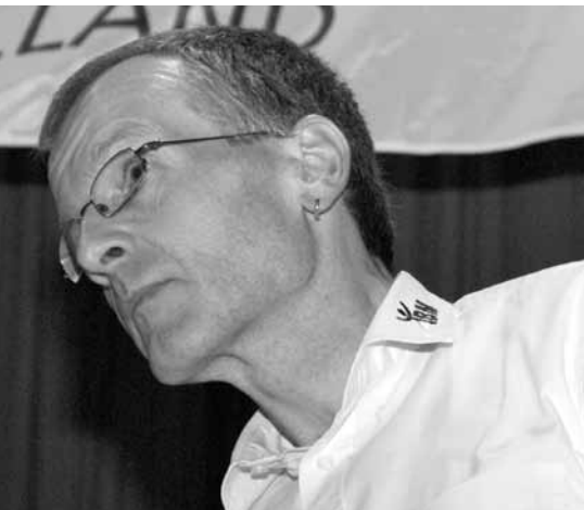
Sichtlich enttäuschter Präsident nach Mitteilung der Fusionsabstimmung im Seeland